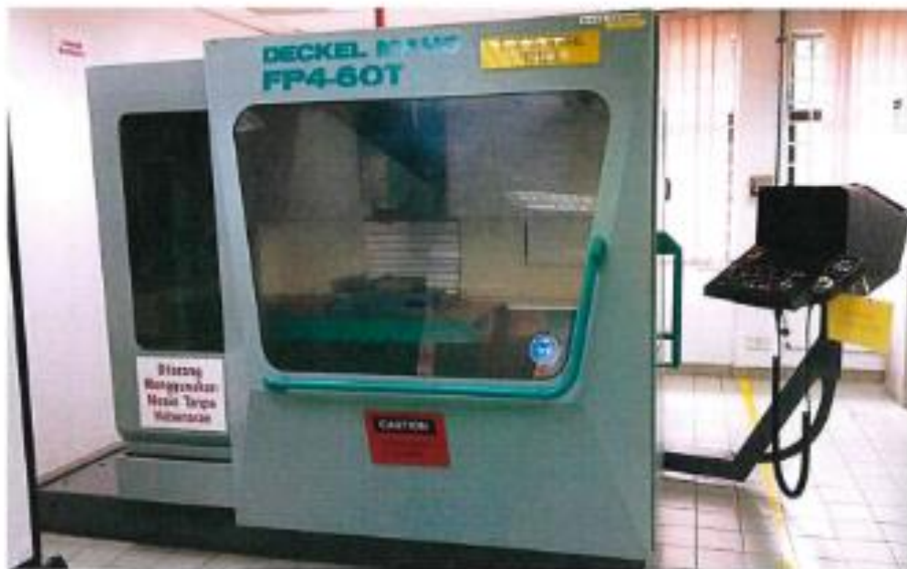
1.1 PANDANGAN HADAPAN