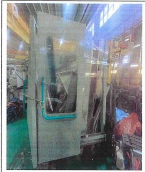
1.2 PANDANGAN SISI