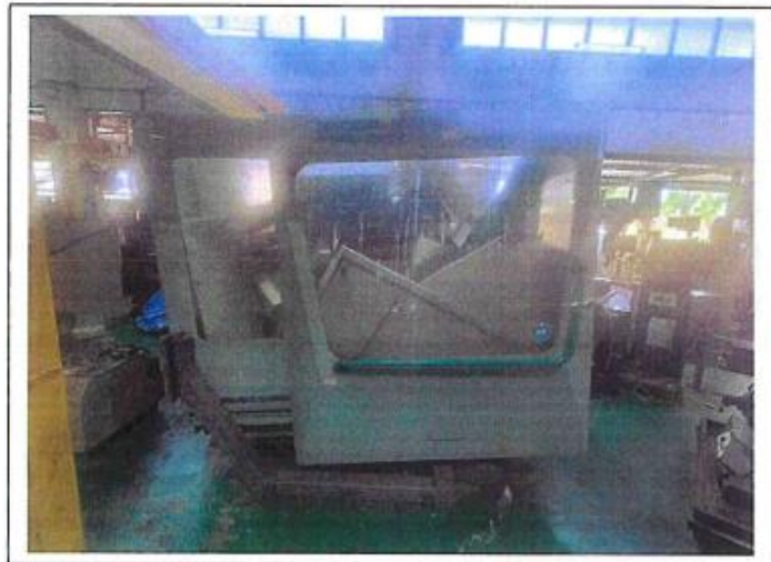
1.1 PANDANGAN HADAPAN

NO. SIRI PENDAFTARAN: KSM/JTM/ILPPG/H/97/20