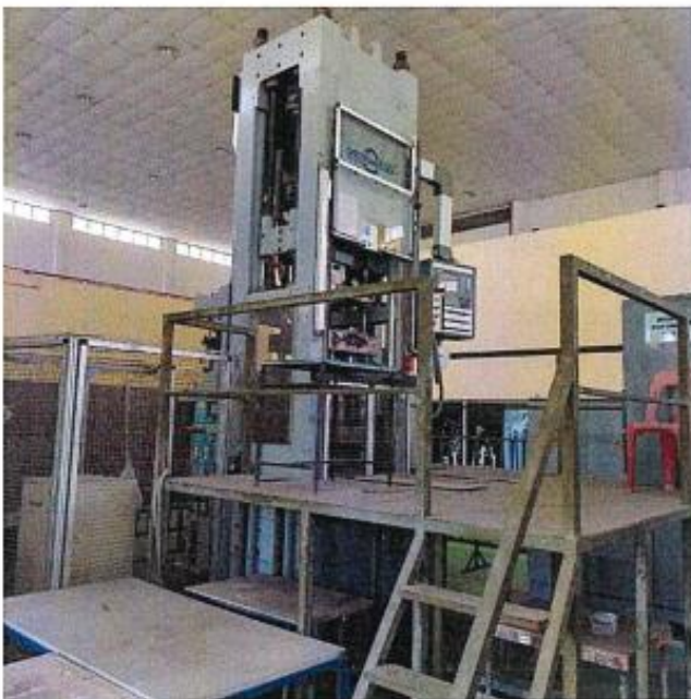
1.2 PANDANGAN SISI