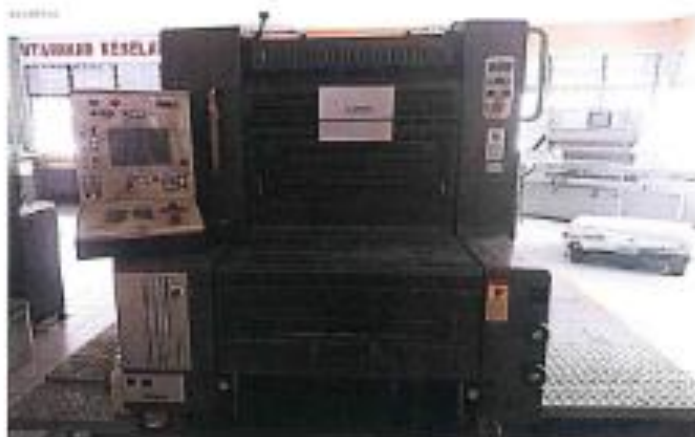
2.1 PANDANGAN HADAPAN