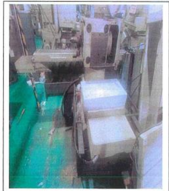
1.1 PANDANGAN BELAKANG