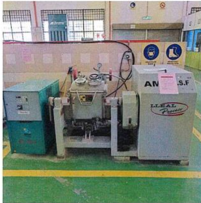
1.1 PANDANGAN HADAPAN

2) NAMA ASET : BLUNGER/MIXER NO. SIRI PENDAFTARAN: KSM/JTM/ILPIPH/H/04/48