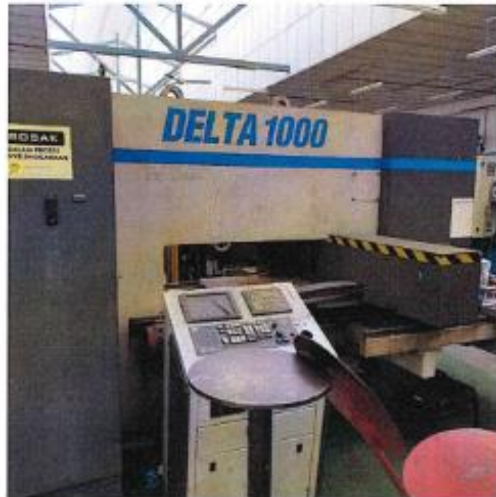
1.1 PANDANGAN HADAPAN

3) NAMA ASET : PUNCHING MACHINE/CNC TURRENT MACHINE NO. SIRI PENDAFTARAN: KSM/JTM/ILPIPH/H/01/47