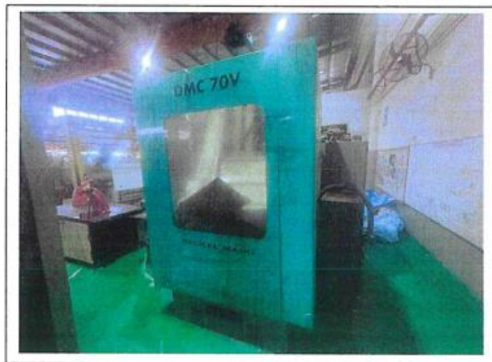
1.1 PANDANGAN HADAPAN

NO. SIRI PENDAFTARAN: KSM/JTM/ILPPG/H/97/410