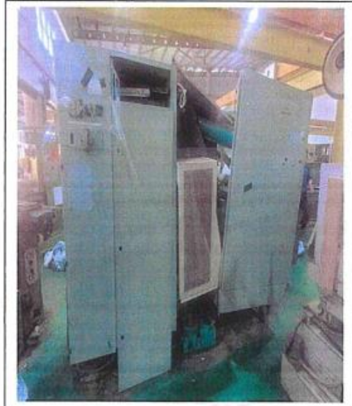
1.1 PANDANGAN BELAKANG