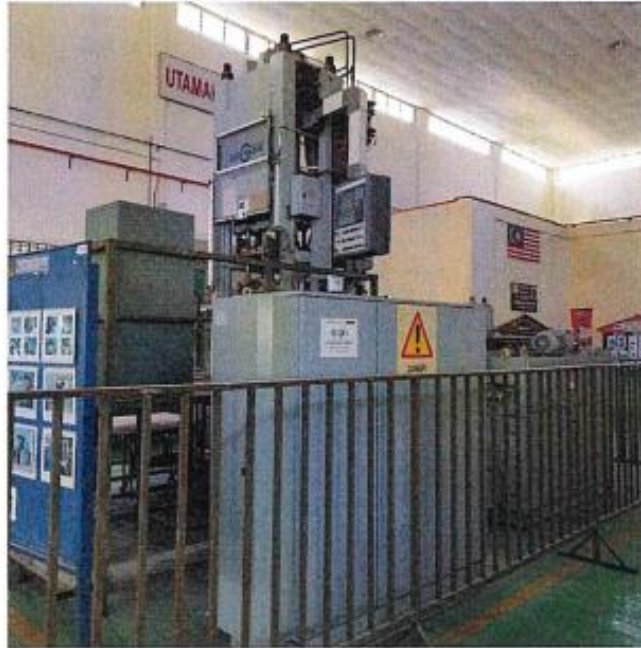
1.1 PANDANGAN HADAPAN