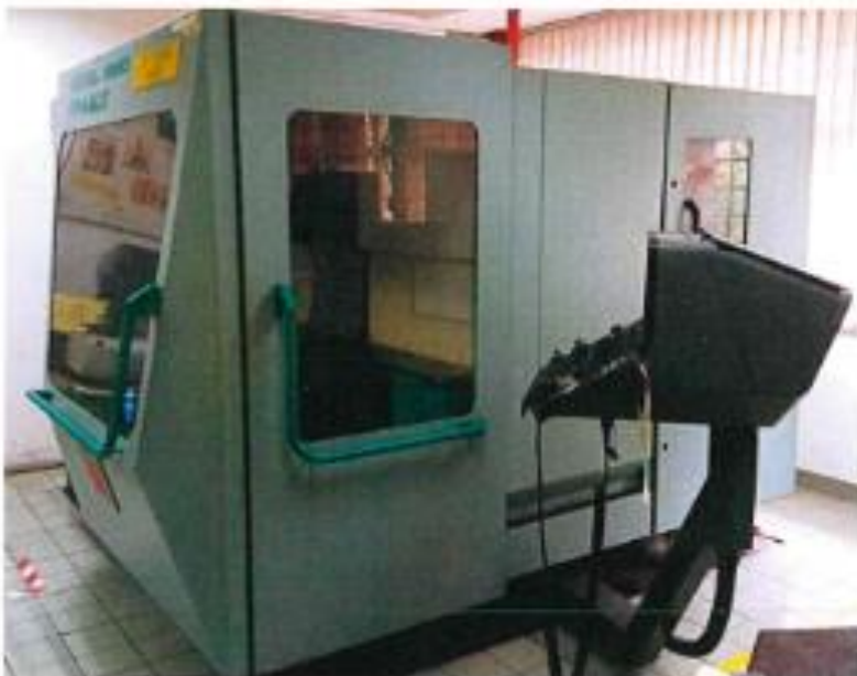
1.2 PANDANGAN SISI