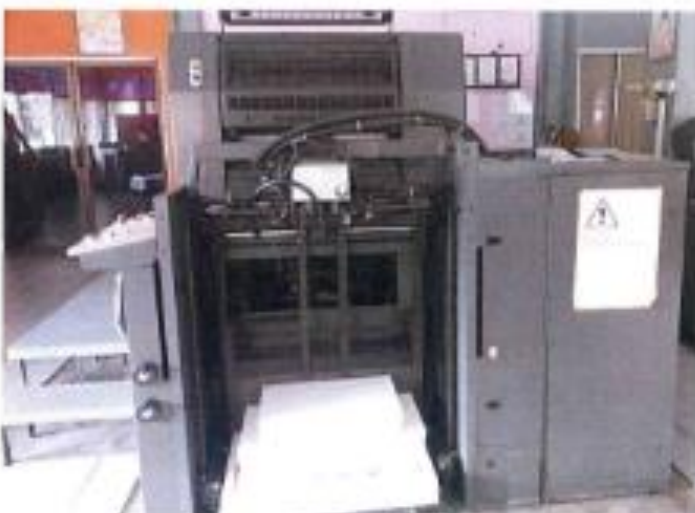
2.3 PANDANGAN BELAKANG