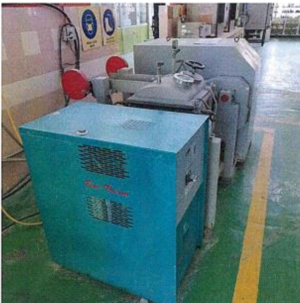
1.2 PANDANGAN SISI