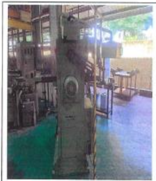
1.1 PANDANGAN BELAKANG