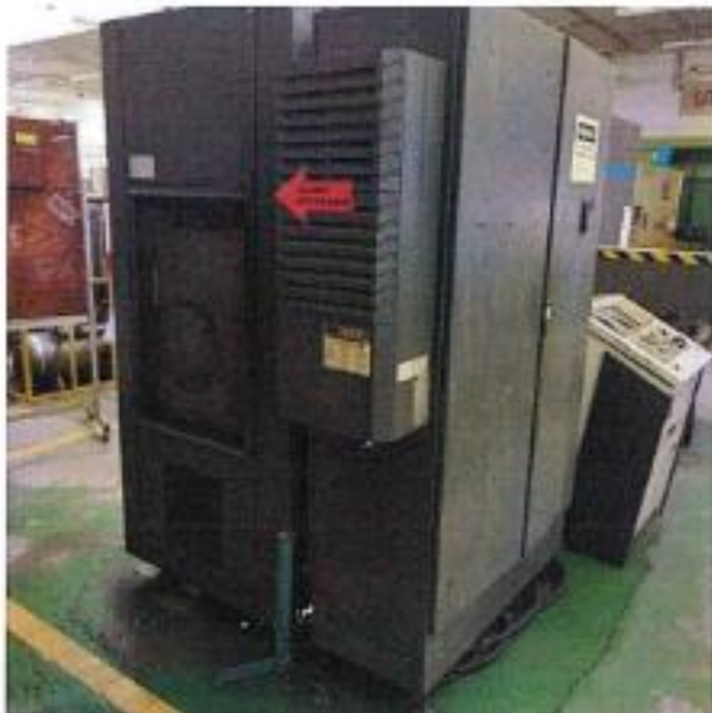
1.2 PANDANGAN SISI