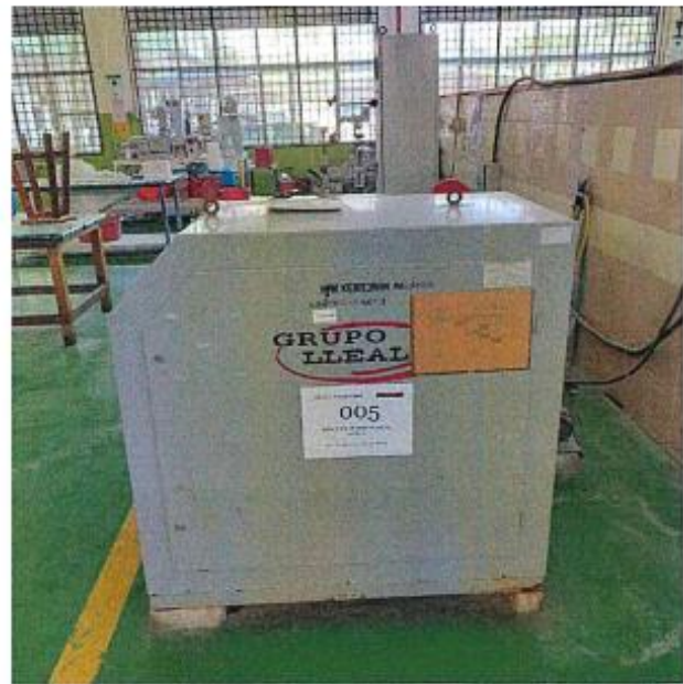
1.3 PANDANGAN BELAKANG