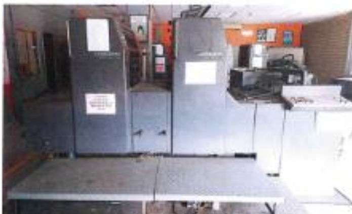
2.2 PANDANGAN SISI