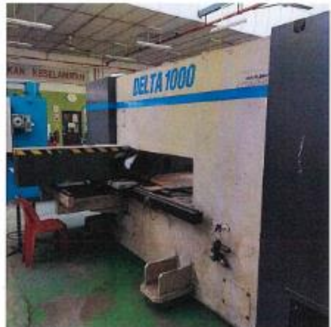
1.3 PANDANGAN BELAKANG