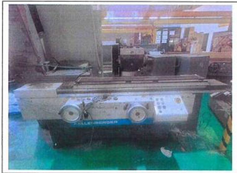
1.1 PANDANGAN HADAPAN

NO. SIRI PENDAFTARAN: KSM/JM/ILPPG/H/97/33