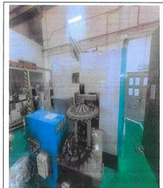
1.1 PANDANGAN BELAKANG