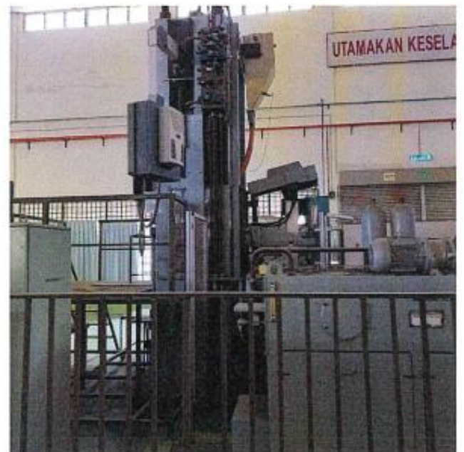
1.3 PANDANGAN BELAKANG