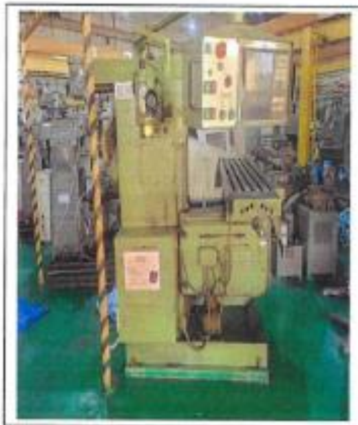
1.2 PANDANGAN SISI