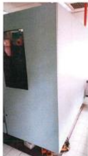
1.3 PANDANGAN BELAKANG