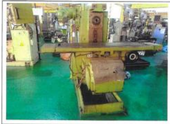
1.1 PANDANGAN HADAPAN

NO. SIRI PENDAFTARAN: KSM/JM/ILPPG/H/96/20