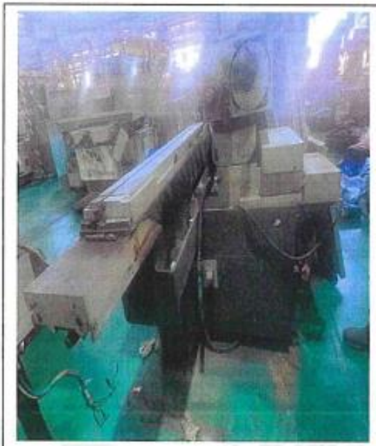
1.2 PANDANGAN SISI